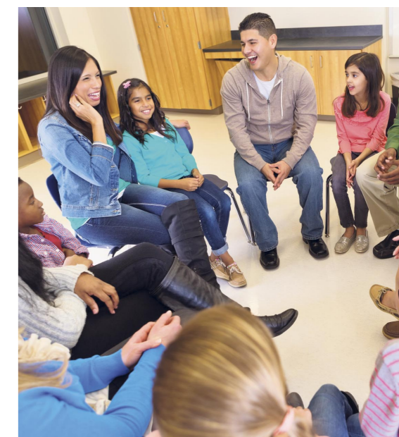
Das Familienzentrum soll unter anderem Plattform für die Vernetzung

Das Familienzentrum soll nicht nur eine Plattform für die Stärkung der Netzwerke der Familien untereinander bieten, sondern auch die Vernetzung von Familien mit Fachpersonen der frühkindlichen Bildung, Beratung, Betreuung und Begegnung fördern. Oft sei die Schwelle, eine Beratungsstelle oder ein Amt aufzusuchen, sehr hoch und die Angebote könnten nicht vermittelt werden und/oder erreichten die betroffenen Familien nur schwer oder verhältnismässig spät, zeigen sich die Verantwortlichen der Gemeinde überzeugt. Ein im Familienzentrum oder Netzwerk gebündeltes Angebot könne die Triage für die Beratung von Familien sowie den Kontakt der Fachpersonen untereinander erleichtern. Durch die Koordination und örtliche Nähe der thematisch diversen Angebote sei es möglich, auch